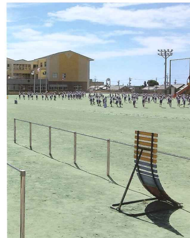
■雄踏小学校グラウンド (静岡県)