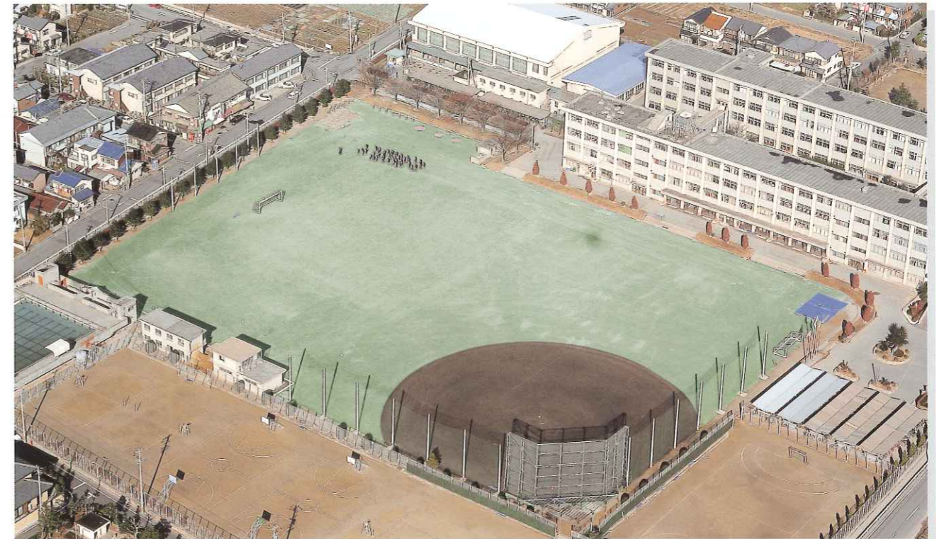
■愛知県立西春高等学校グラウンド

注：過度に乾燥した状態での、スライディング等のプレーにより擦過傷を起すことがあります。 競技に応じて散水・ほぐし等を施しベストコンディションで使用して下さい。