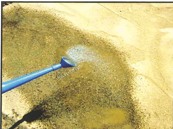
⑤ジョウロやシャワーノズルなどで散水 する。1~2時間後に二次散水をする。