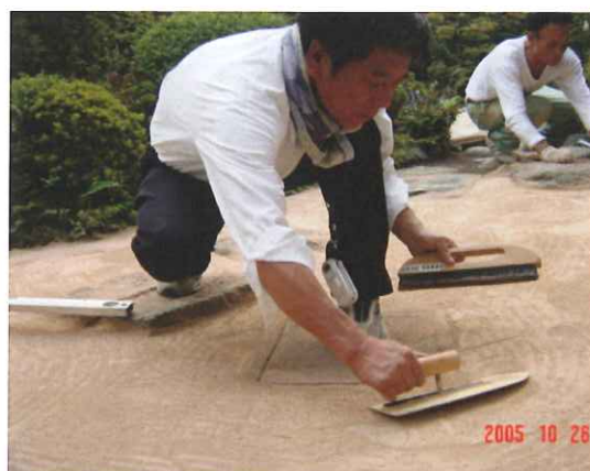
④コテ、ブラシなどで均す