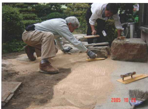
③コテなどで整地する。