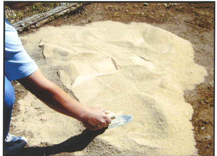
④コテやブラシ、トンボ、角材などで 均し転圧をかける。