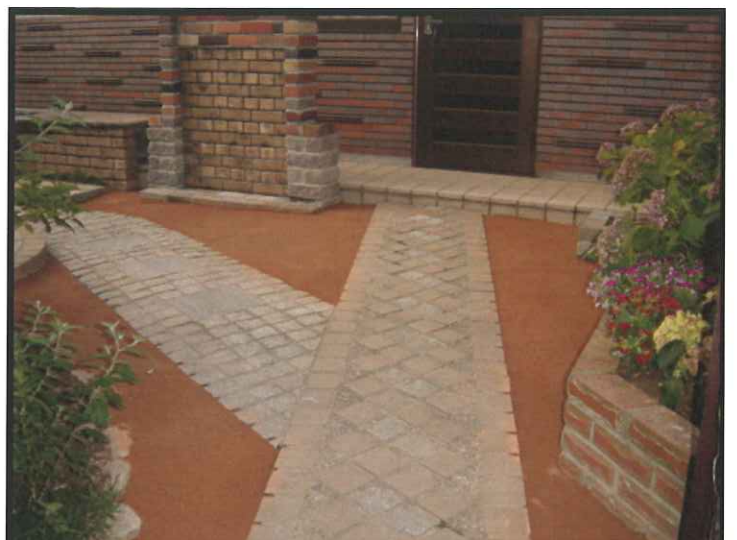
花壇と玄関周りの防草