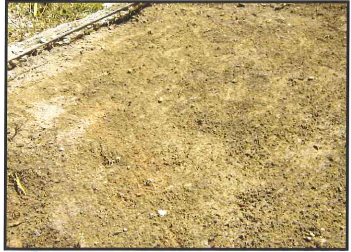
②雑草や根を取り除き、整地します。 軟弱な所は、しっかりと固めて下さい。