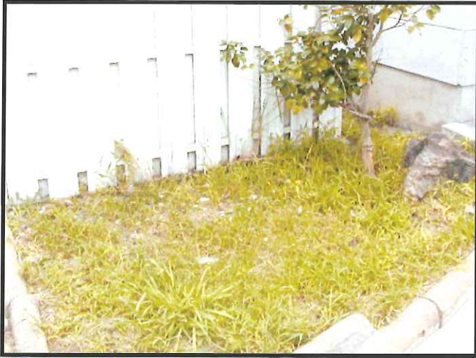
①防草したい場所の選定