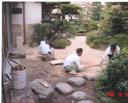
②ガーテントを敷く