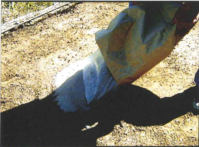
③ガーデンコートを敷く